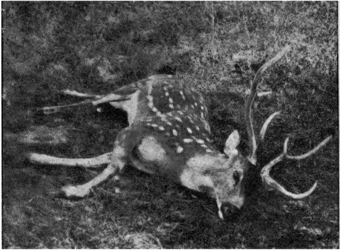
चीतल ( स्वर्णमृग )